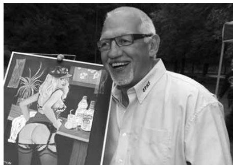
Un grand merci à Kaka pour l'organisation du Tête-à-Tête