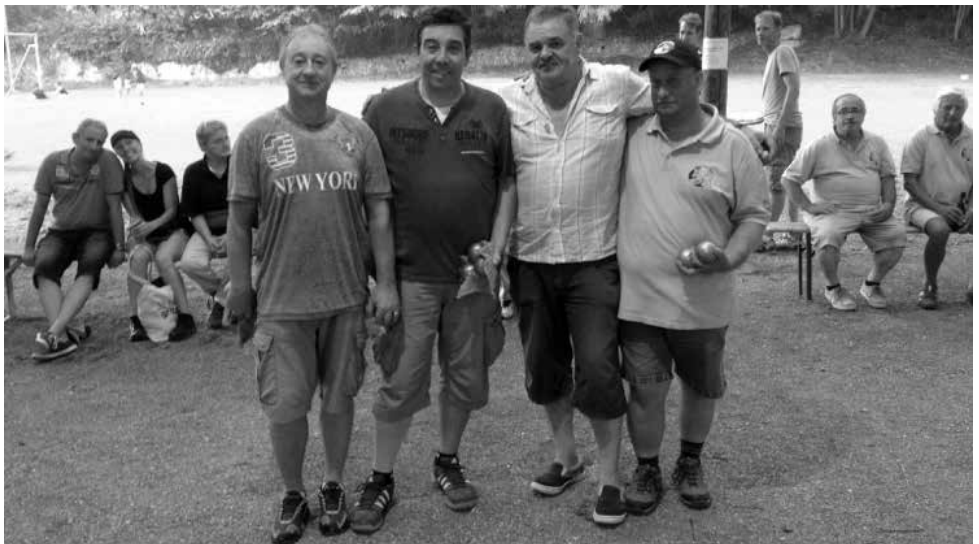
Les finalistes. Et on a à nouveau perdu le président...