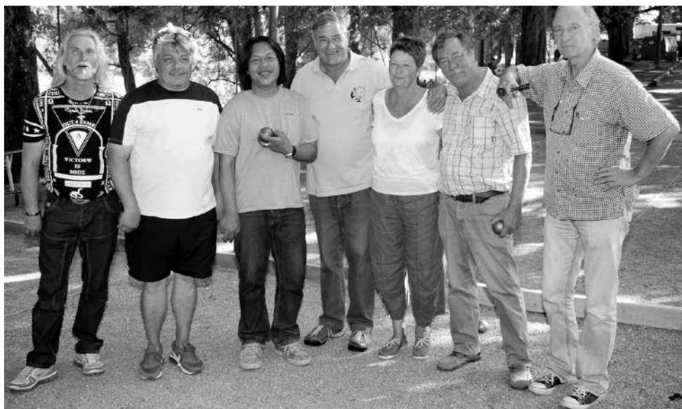
Le président et les finalistes