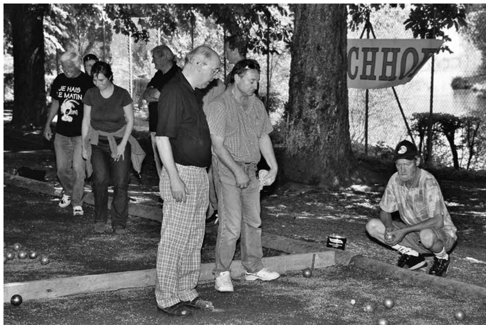
Concours en doublettes - Août 2003