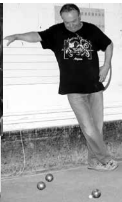
... prises ...