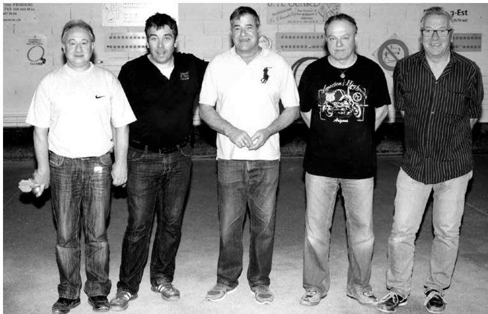
Les finalistes et un président heureux