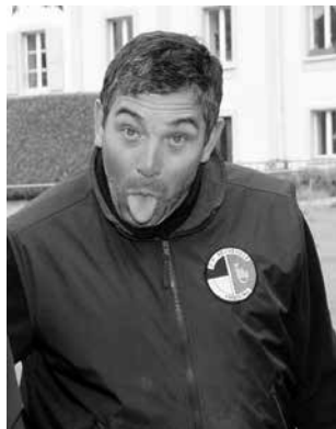
... en 2015 au ...